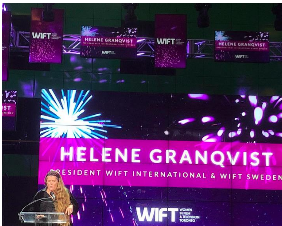
Toronto 11 september 2018