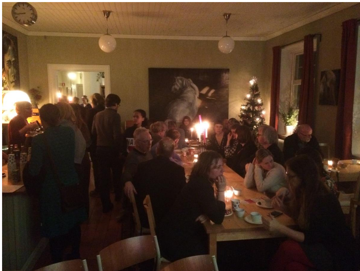
Bildtext: Kortfilmsdagen på Gunnerudsgården i Östra Ämtervik.

På Gunnerudsgården visade Wift Värmland och Region Värmland tillsammans kortfilmer på Kortfilmsdagen.